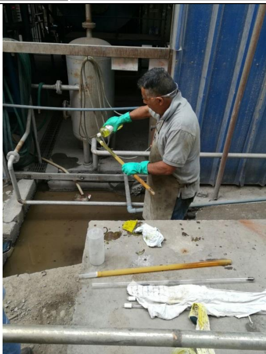
Limpieza lámparas UV