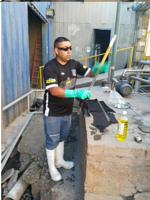
Limpieza lámparas UV