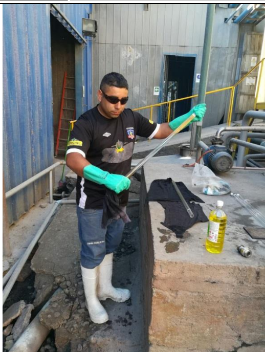
Limpieza lámparas UV