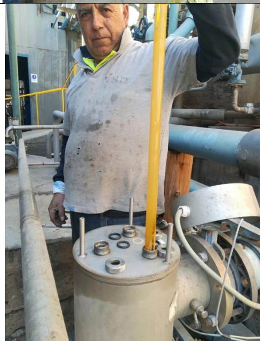
Montaje de lámparas UV en el módulo