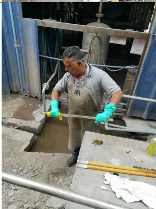
Limpieza lámparas UV